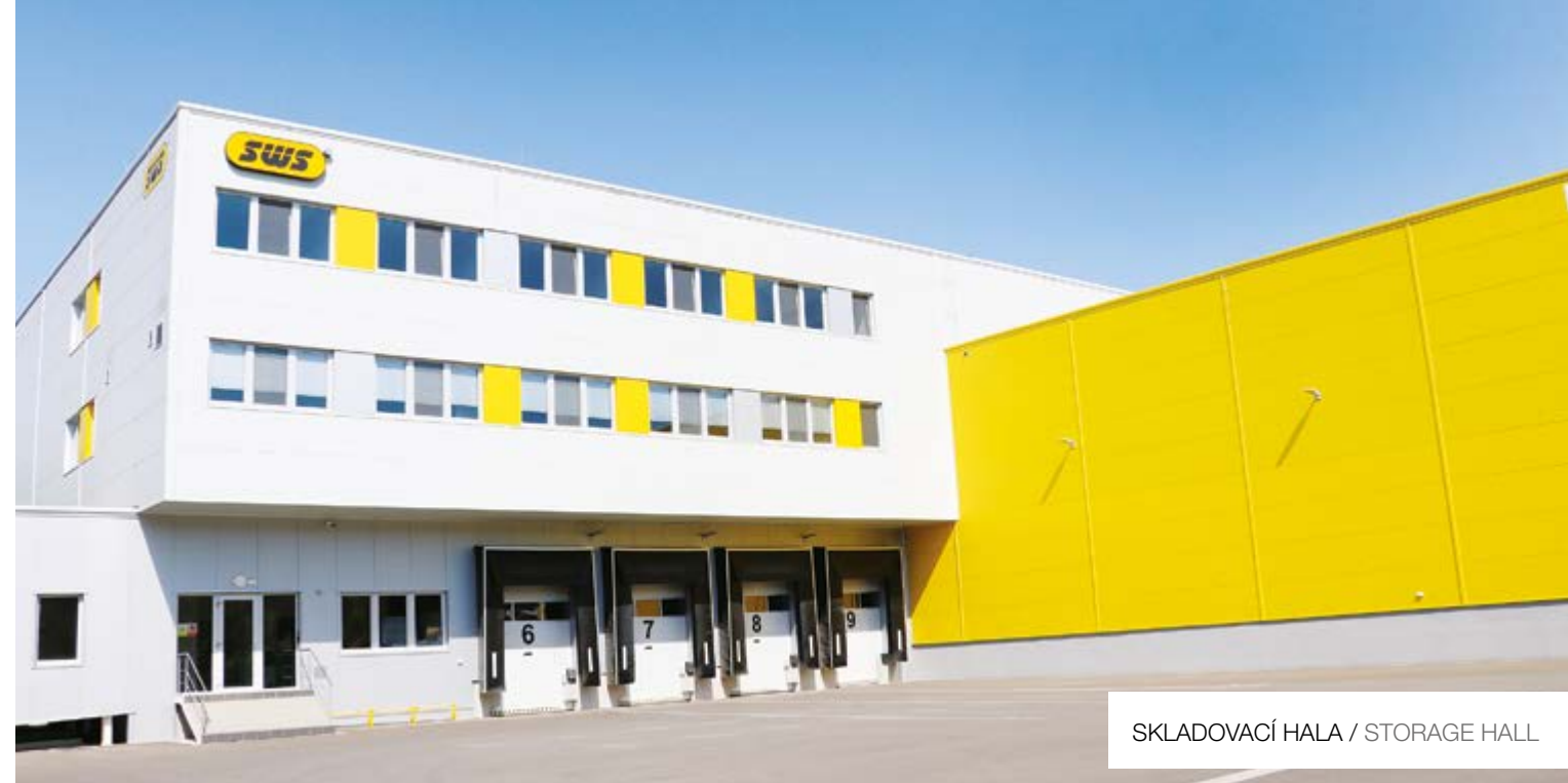
SKLADOVACÍ HALA / STORAGE HALL