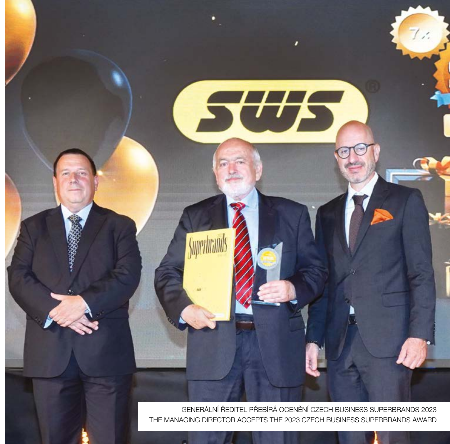
GENERÁLNÍ ŘEDITEL PŘEBÍRÁ OCENĚNÍ CZECH BUSINESS SUPERBRANDS 2023 THE MANAGING DIRECTOR ACCEPTS THE 2023 CZECH BUSINESS SUPERBRANDS AWARD

SWS won the title of largest volume distributor of Lenovo ThinkSystem servers for the year 2021/22 in the Czech Republic.